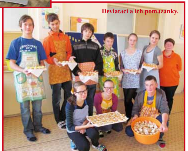
Deviatci a ich pomazánky.