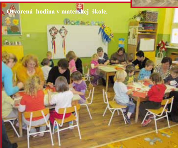
Otvorená hodina v materskej škole.